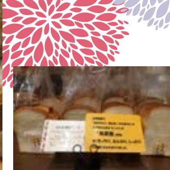
CENTRE THE BAKERY 使用北海道小麥製作吐司。