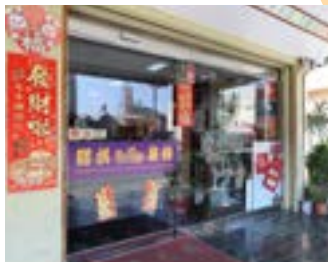
勝棋製餅舖開業 60 年，是新園人心目中的首選糕餅名店。