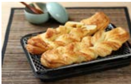
使用南僑冷凍麵糰烘烤丹麥香蒜派司香氣逼人。