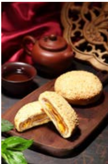
虱目魚 Q 餅。