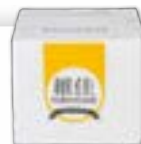
OAL31888 維佳特濃烘焙油脂