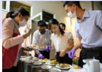
與會業者試吃現場提供的漢餅及麵包新品，無不留下驚艷印象。

南僑油脂多年來定期舉辦講習會，開發製作最新產品、提供產業趨勢資訊，已成為客戶研發新品、拓展消費市場不可或缺的助力。因疫情睽違兩年之後，2023年下半年以「當今在地」為主題，於台北、台中、高雄舉辦專題講習會，吸引上百位在地烘焙業者熱烈參與，針對食材、作法及國內外消費趨勢等面向分享交流。