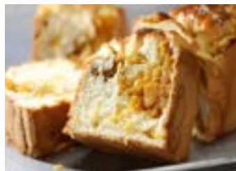
鳳梨吐司餡料飽滿扎實。

親傳承的「三不」原則讓餅舖安然挺過多次食安風暴，在消費者心中成功建立信任感。「這也正是勝棋製餅舖選擇與南僑長期合作最重要的原因。南僑在原材料研發、品質把關與資訊技術交流的優異能力，讓我們可以沒有後顧之憂，繼續向前衝！」