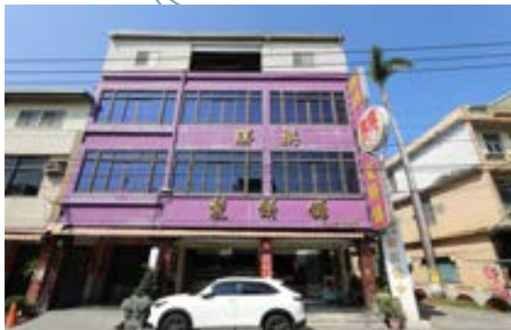
勝棋製餅舖新園本店。