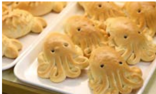
電視影集「魷魚遊戲」爆紅，魷魚造型麵包買氣跟著大旺。