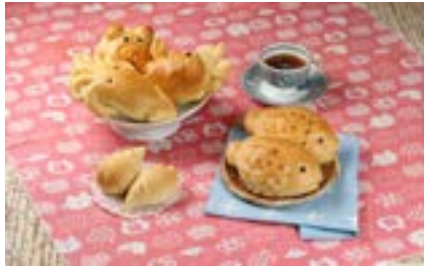
各種動物麵包造型可愛，風味樸實天然。