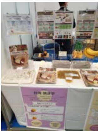
台灣的地瓜、鳳梨、香蕉也成了日本烘焙產品的應用食材。

米粉、耐熱性酵素，使麵包具備高保濕、有嚼勁，延緩老化的特性，和傳統湯種做法比較起來，操作簡單便利，品質也更加穩定安全。