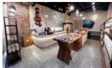
手握幸福門市店景。