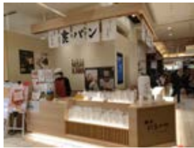
異地體驗不同場域的烘焙文化，交流、激發更好的創意。