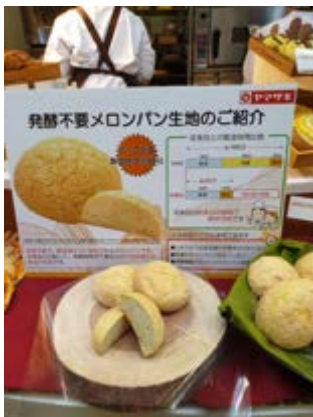
冷凍麵糰不需發酵、解凍即可烘焙，在日本應用廣泛。

以急凍技術製作的冷凍麵包、冷凍麵糰不需發酵、解凍即可烘焙，在業界應用愈發廣泛，STYLE BREAD、ヤマサキ等麵包大廠採用國產麵粉及糯