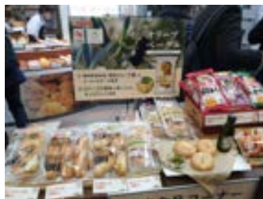
應用在地食材創意多元。