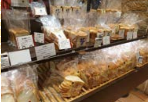
因應網購市場，日本業者研發專用麵包保鮮袋，以減少風味散失、氧化、口感老化及降低微生物風險。