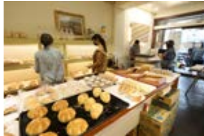
開業 20 多年的加賀專業烘焙是在地居民買麵包點心及伴手禮的首選。