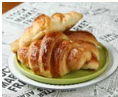
牛角可頌。