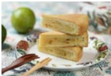
清香檸檬大餅完美融合酸甜風味。

期，因綠豆沙常缺貨，餅店師傅便改用蓮藕粉或杏仁粉加上糖粉替代，意外烤出另一番風味，因餡料雪白而得名並廣為流傳。勝棋製餅舖用麵粉、片栗粉、煉乳加入松子，綿細口感混合淡淡堅果香，廣受喜愛。傳統肉餅則使用豬後腿肉混合肥肉再加入手切紅蔥頭酥、特製的黑糖冬瓜，拌入自製滷汁再包進鹹蛋黃，完美融合餅香、肉香與蛋香，食感豐