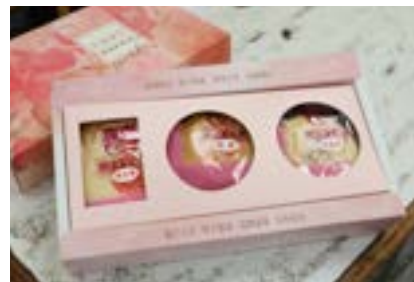
綠豆椪、龍鳳餅、肉餅「三合一」是勝棋製餅舖熱門的喜餅組合。