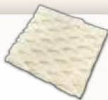
NA050223 威靈頓酥片 (B-1)